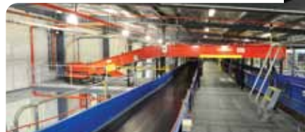
6. Esteiras transportadoras