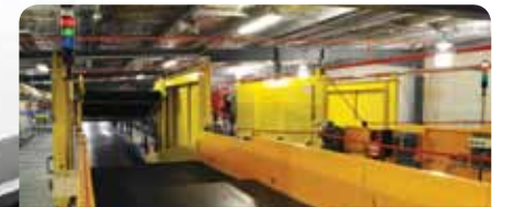
9. Unidade de triagem vertical