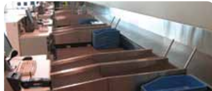
2. Esteiras de check-in