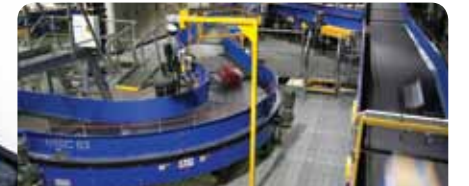
8. Esteiras curvas