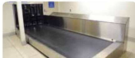
4. Esteiras extra-grandes