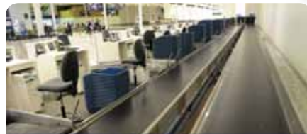
3. Esteiras coletoras