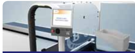
1. BAGgate® Despacho de bagagem automatizados