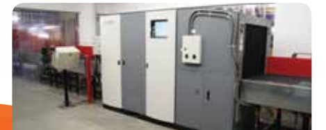
12. Integração com raio-X