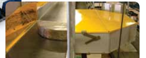
10. Sistema de seleção de bagagem