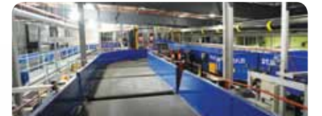
7. Esteiras de enfileiramento